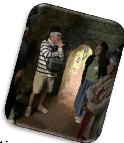
Mobilité géographique et découverte d'Arras & Vimy