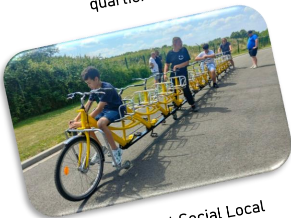
Développement Social Local Le Rotois : En attendant le Tour de France