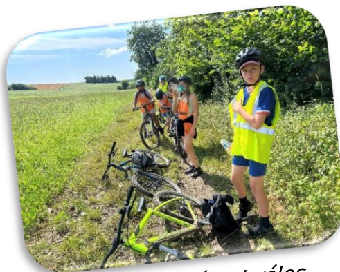
Séjour itinérant vélos « Itiner'action »