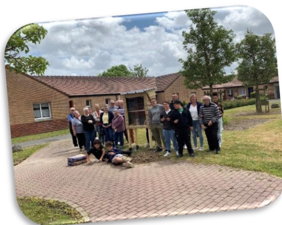
Restitution de la boîte à livres et hôtel à insecte au Béguinage « Les Charmilles » Libercourt