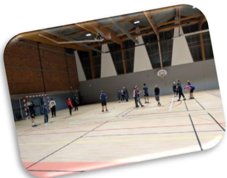
FUTSAL LIBERCOURT Valoriser le sport en quartiers

Sélection d'actions collectives et de projets spécifiques :