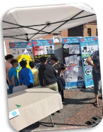
Forum «Prév'Ados » A Oignies