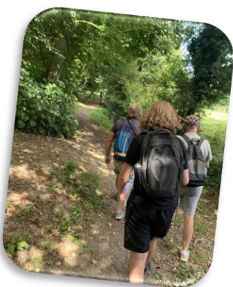
Journée rando à Bours