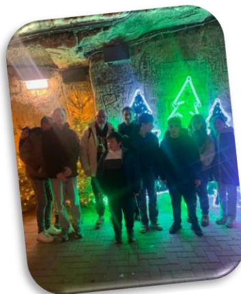
Mini séjour à Valkenburg Magie de Noël aux Pays Bas