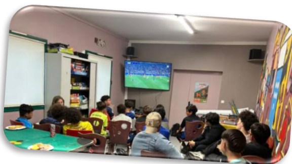
Soirée Ligue des Champions Finale PSG/Inter Milan A l'Escale de Libercourt