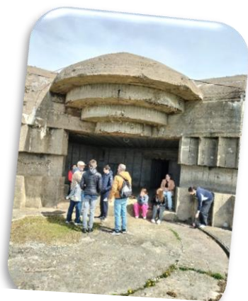
Sortie culturelle à Wimereux « Découverte du mur de l'Atlantique »