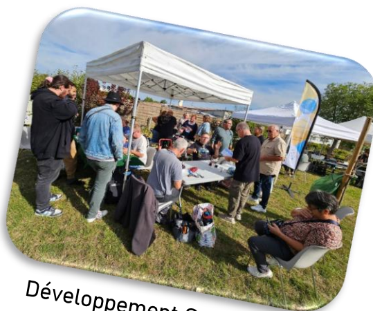
Développement Social Local La Justice : solidaire, active et dynamique